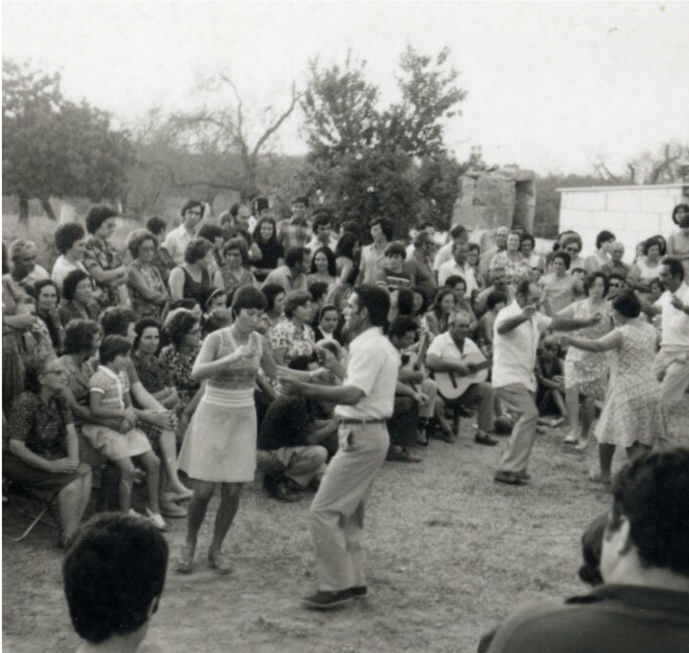
Escena d'un ball a la carrera de les cases de Son Berga, a Sant Llorenç des Cardassar, el setembre de 1974. Més informació sobre aquell dia aquí.