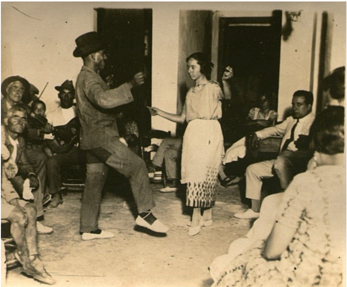
Un ball a Felanitx, any 1926.

[...] L'amo en Rotger no podia sofrir cap sonador de guitarra . Tothom, per ell, tocava malament. Només tolerava un poc en Biel de Son Virgo perquè ell n'hi havia ensenyat; tots els demés no es podien sentir.