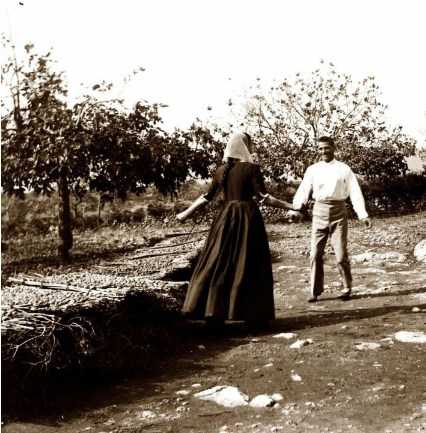
Una colla improvisa un ball al sequer. A l'esquerra, els canyissos carregats de figues i col·locats damunt feixos de brancam per assegurar una bona ventilació. Autor desconegut.

Els balls de sequer o de figueral foren pràctica relativament habitual fins mitjan segle passat. Els sequers constituïren, durant una llarga època, un dels principals contextos on el ball de bot es mantingué viu a Mallorca, malgrat el declivi general que s'escampava dels balls de bot a principi del segle XX. Els balls d'aferrat començaven a suscitar més interès, però ambdós estils convisqueren una partida de dècades. Per tal d'oferir una mica de context , trob adient compartir el següent fragment de l'investigador mallorquí Ramon Morey, qui descrivia així l' estat dels balls a Mallorca l'any