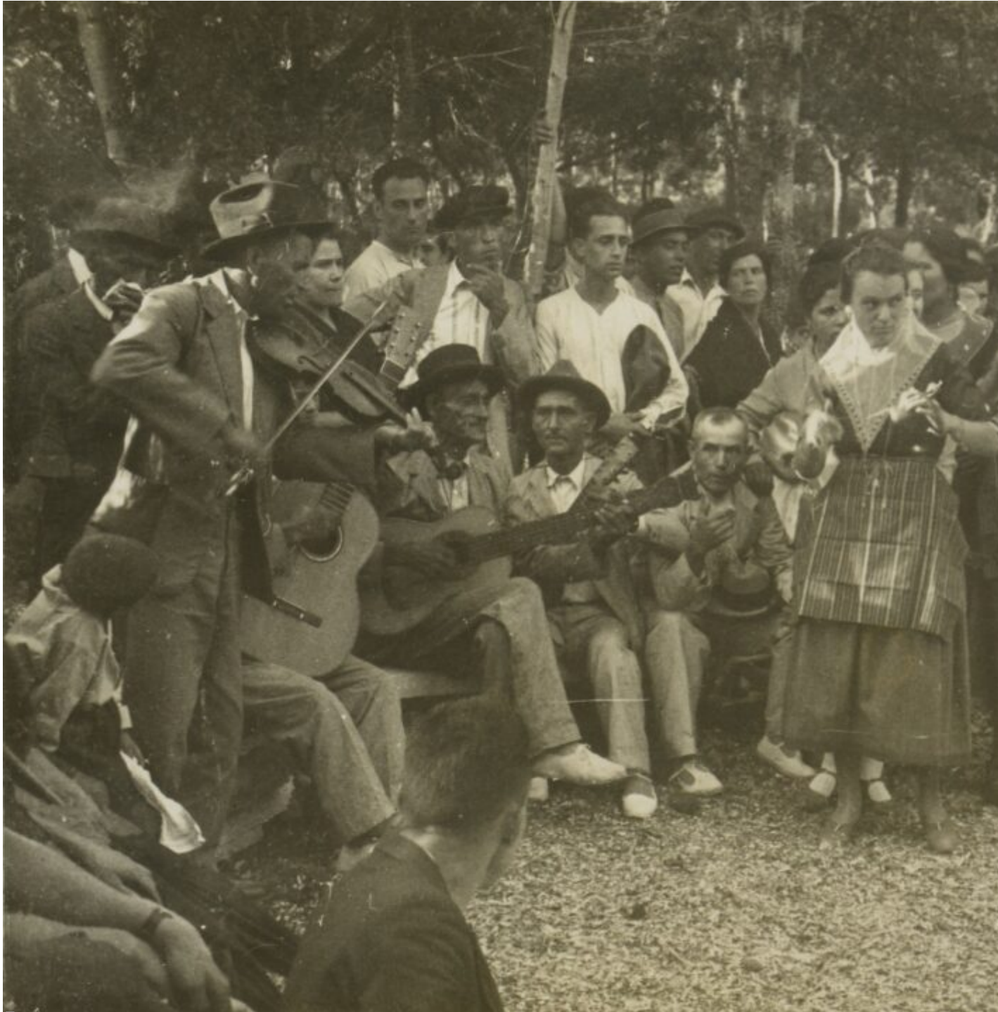
Un ball a Pollença l'any 1930. Els músics sonen guitarra, guitarró i violí. Algunes balladores sonen també castanyetes.