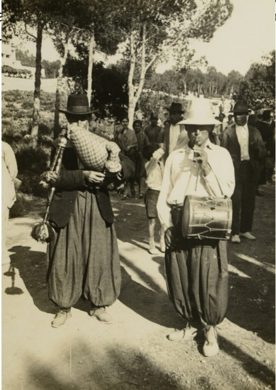
Xeremiers a Pollença l'any 1930.

Hem de recordar que els balls importants , o sigui, tant els balls de sequer especialment concorreguts, com els balls "públics" -dels quals avui no hem parlat-, solien comptar amb la figura del batle o revetler , que era aquella persona o persones que s'encarregaven del correcte desenvolupament del ball. El batle tant s'havia d'encarregar que no hi mancassin bons sonadors, com de tenir els millors balladors de la contrada dins el ball i al llarg de la vetlada. Per tant, que s'esbucàs u