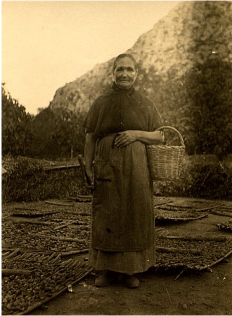
Una figueralera enmig d'un sequer a Pollença, any 1924.

El temps de secar les figues: final d'agost i tot el setembre, molta gent del poble surt per viure al camp on lloga els figuerals [...]. A l'horabaixa, giren les figues que ja tenen una part seca i llavors es criden d'un a l'altre figueral amb corns i crits especials molt allargats, els quals solen variar a cada encontrada. S'ajunten les figueraleres i els figueralers i missatges dels voltants a una qualsevol de les casetes o possessions i, acabada la tasca del girar, a la qual ajuden els que van arribant, comencen a ballar , amb instruments si en tenen, i si no amb mamballetes, tocs sobre els bancs i pasteres, etc. El ball sol durar fins ben envant de la nit .