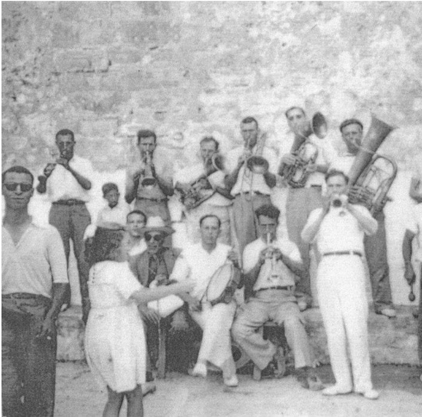
La banda de música d'Alcúdia al ballador de la Victòria, l'any 1935.

També més antigament, si els amfitrions tenien recursos, eren bandes de música senceres qui animaven el ball més important de la temporada. És el cas, per exemple, d'un ball de figueral celebrat a la posada de Can Seguer , a Alcúdia, els anys 1910. En aquesta ocasió, convidaren la banda de música de Búger perquè animassin la vetlada.