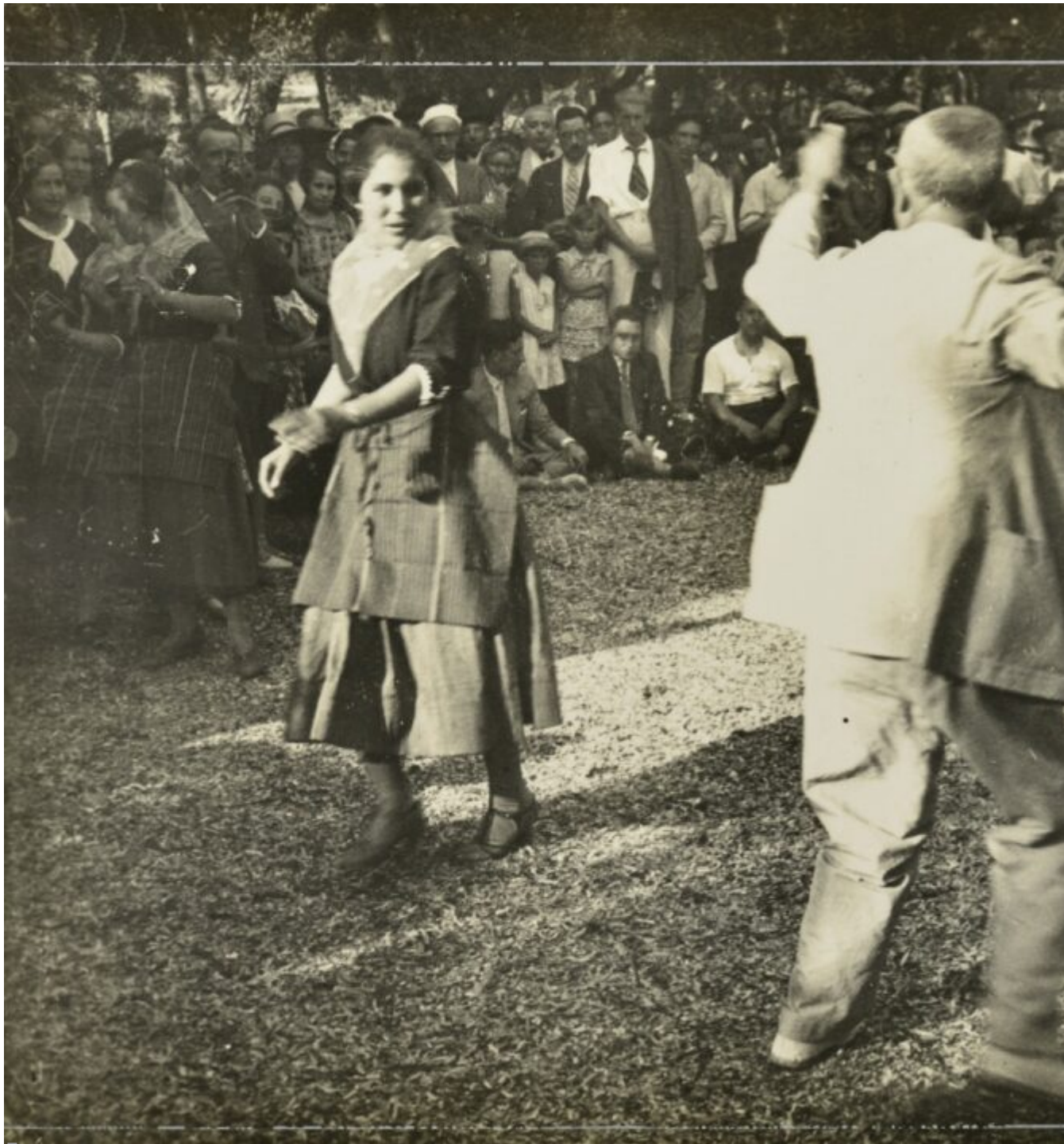
Ballant boleros a Pollença, any 1930.

El vespre, el ball [...]. S'improvisava una taverna possant-hi una taula amb begudes que ajudaven en els costos de la organització. Els fadrins de la vall aportaven sis reals amb dret a sopar. El llum que s'emprava era "el carburo ", encara no hi havia per les possessions electricitat [...].