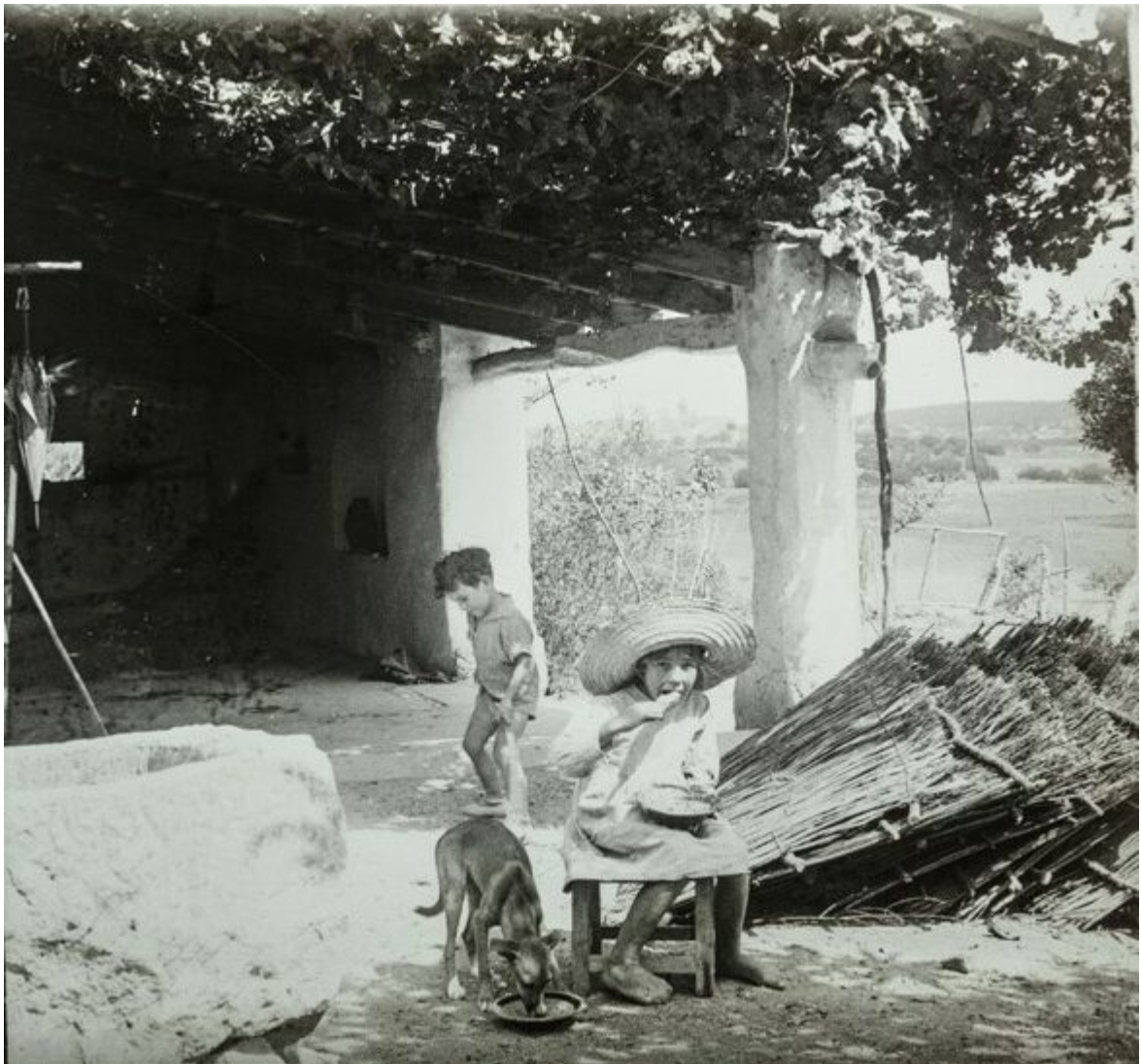
Escena a la porxada d'una caseta de figueras, a principis del segle passat. Es veuen bé els canyissos preparats que encara no s'han col·locat per assecat-hi figues.