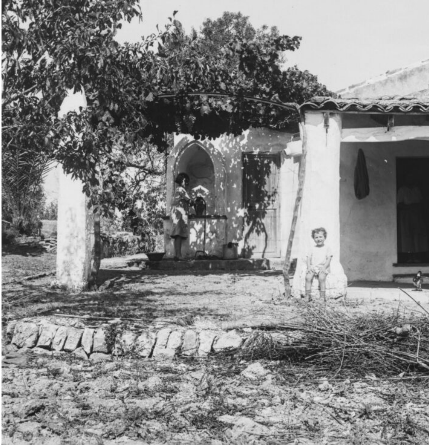
Caseta de figueral, primera dècada del segle XX. Hi veim tots els elements típics de les casetes de figueral: l'esplanada exterior, la porxada, l'emparrat, la cisterna... Fixau-vos amb el ganxo figueraler a la branca del portal!