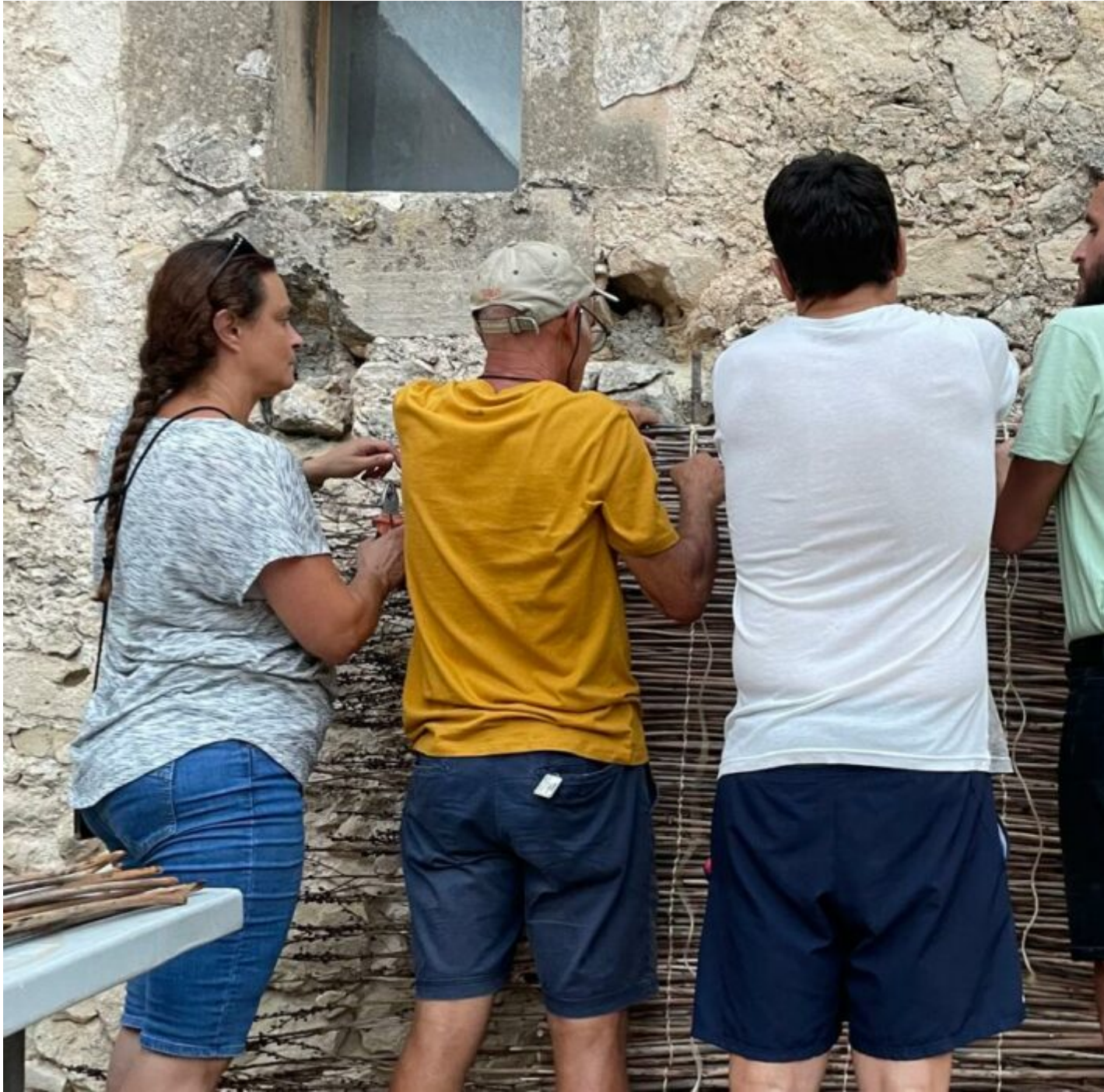
Moments d'un taller de fer canyissos organitzat per ARCUFI a Lloret de Vistalegre.

A Lloret , a més, ja fa 44 anys que hi celebren la Festa des Sequer , un punt d'encontre per a tots els amants de la figuera i una via de difusió i de recuperació de les figues així com de la cultura popular que les envolten. Cada any, d'entre els lloritans majors de 75 anys, es trien dos figueralers , que són els protagonistes de la festa el dia de la Festa des Sequer. D'uns anys ençà, a més, s'ha instaurat també la figura dels figueralers joves , representats per un al-lota i un al-lot del poble.