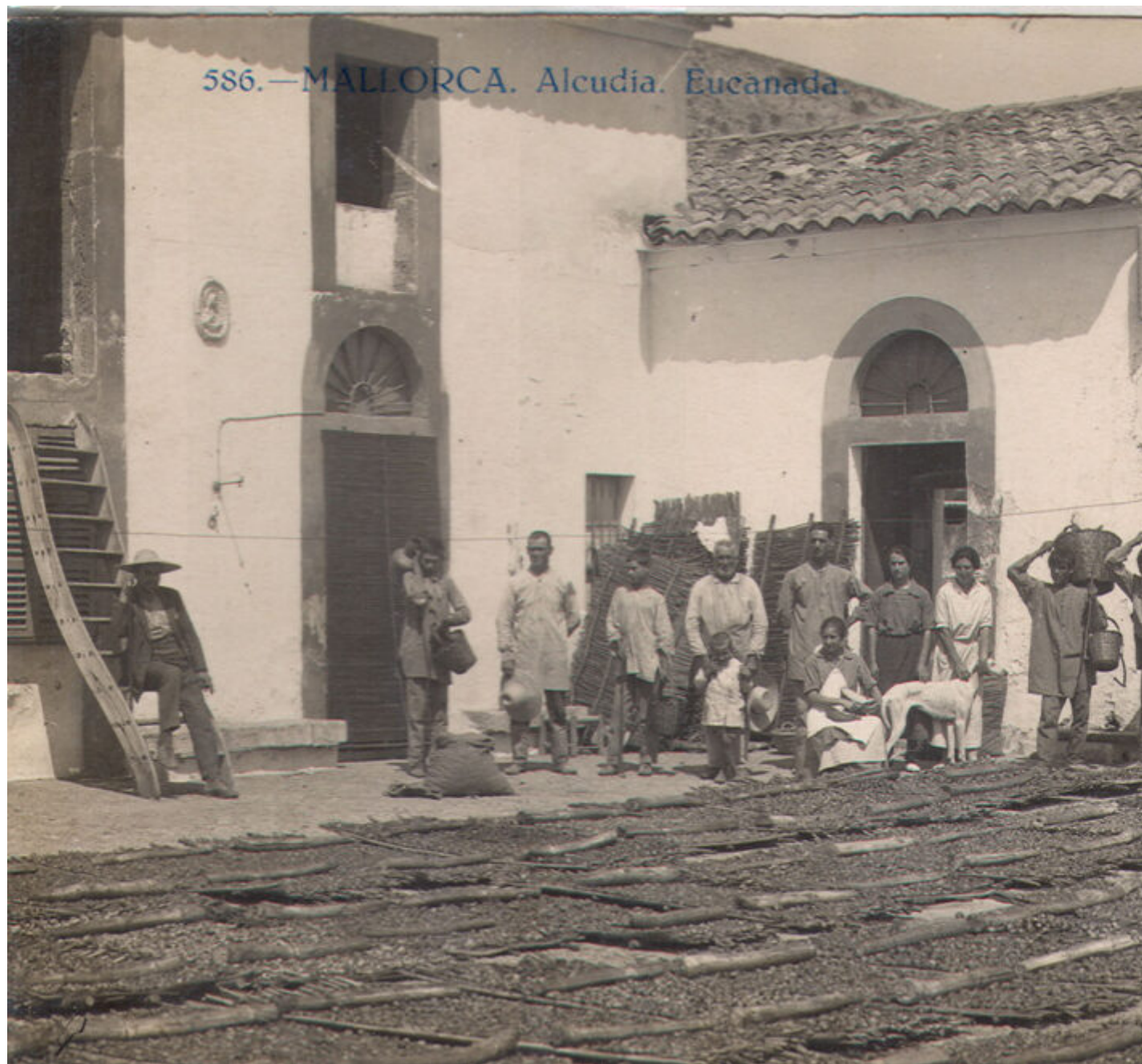
Un sequer de figues a les cases de la possessió d'Alcanada, a Alcúdia, a principis del segle passat.

Un pobre figueraler passa la vida penada, perquè en veure ennegulada corrensos a entrar es sequer.