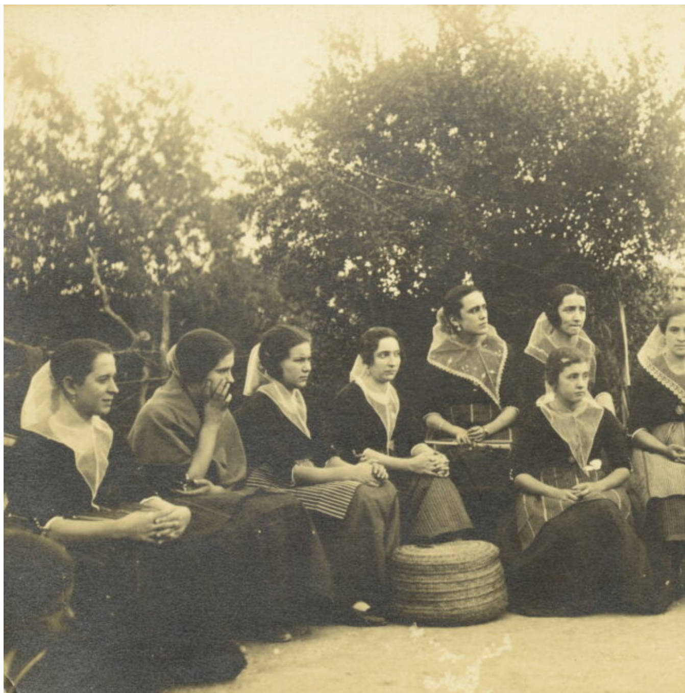
Escena d'un ball a Pollença, corresponent al primer terç del segle XX. Aquesta foto s'ha fet servir de postal.