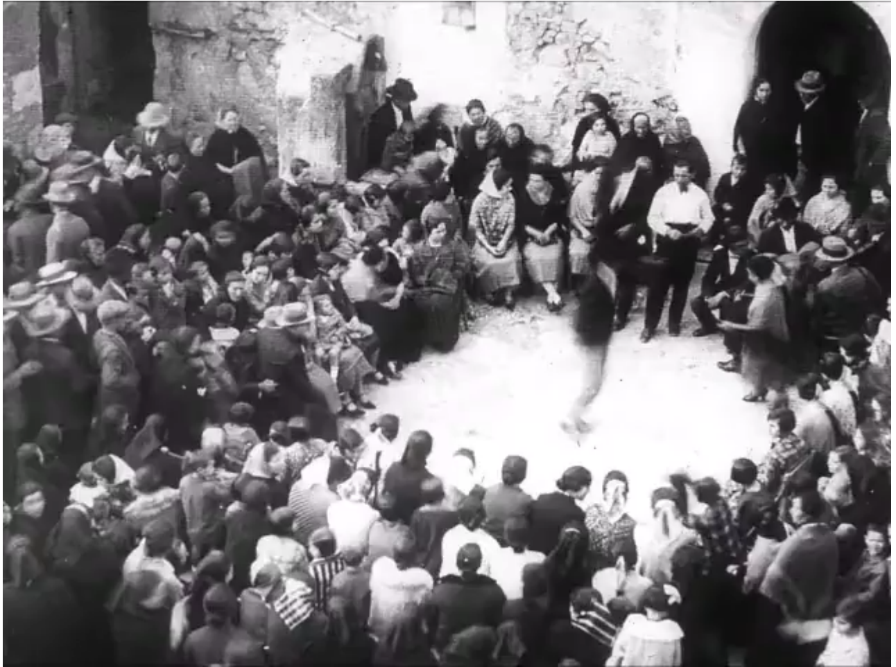
Escena d'un ball de principis de segle XX.